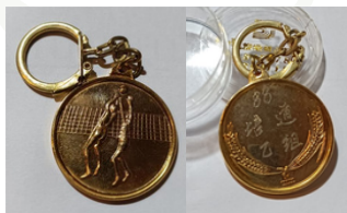
1988年三毅班所贈予的獎牌