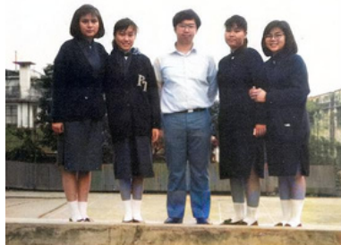
1986年第一年任教的中五同學