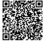
恆常義工 及義工服務隊報名表