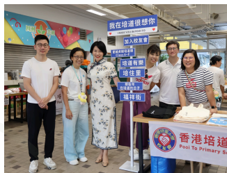
香港培道小學校友會職員會

秋高氣爽的中秋佳節，正是團聚的好時刻。今年，培道校友會舉辦了一場耳目一新的中秋市集活動。雖然天公不作美，偶有滂沱大雨，卻絲毫不減當日參與市集的人數與熱情。